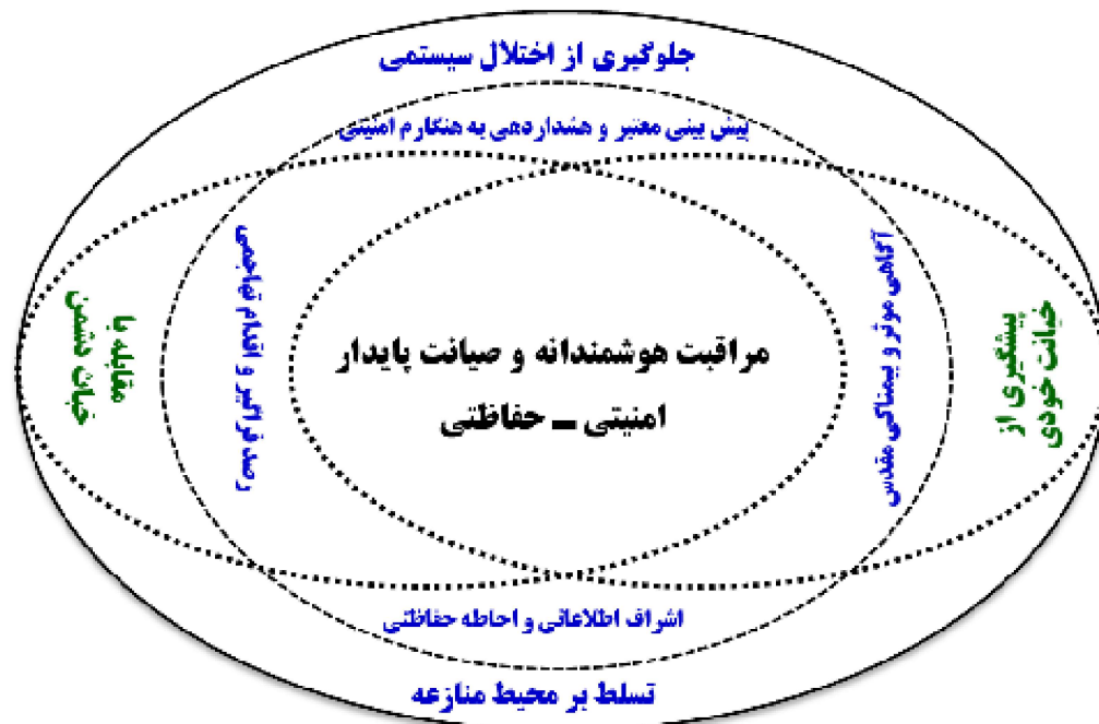
شکل شماره ۱: مدل مفهومی برآمده از قضایای سازنده نظریه مرجح حفاظتی مقام معظم رهبری (مدظله العالی)

بازتاب امنیتی (۵) «تسلط بر محیط منازعه» پیامد «اشراف اطلاعاتی و احاطه حفاظتی» است. در مجموع با تکیه بر نظریه مرجح «مراقبت هوشمندانه و صیانت پایدار امنیتی - حفاظتی» و با توجه به «پیش فرض‌های پنج گانه» ارائه شده و «بازتاب پنج گانه» تدوین شده می‌توان به یک مدل مفهومی ذهنی دست یافت که علاوه بر تعیین مؤلفه‌های اصلی و فرعی، امکان ادراک روابط منطقی میان این مؤلفه‌ها تسهیل می‌شود. مدل مفهومی مورد نظر به شرح زیر می‌باشد: