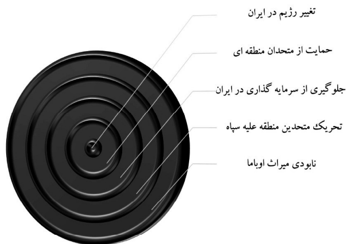
شکل شماره ۲: اهداف ترامپ در قبال قرار دادن نام سپاه در فهرست گروه‌های تروریستی

سیاست تحریمی دولت اوپاما بیشتر مبتنی بر انگیزه متعهدسازی ایران به قواعد و هنجارهای بین‌المللی بوده است، انگیزه اصلی دولت ترامپ، پیشبرد حداکثری منافع ملی آمریکا فارغ از چارچوب‌ها و محدودیت‌های حقوقی بین‌الملل است. از این منظر، پذیرش برجام برای دولت اوپاما سیاستی کارآمد بود، چون سیاست هسته‌ای ایران را با هنجارهای بین‌المللی هماهنگ می‌کرد، اما برای دولت ترامپ با این استدلال که آن فاقد منفعت قابل توجه برای آمریکاست، ناکارآمد تلقی شد (قنبرلو، ۱۳۹۷: ۷۶ - ۷۷). «ترامپ بارها اعلام کرد که سیاست‌های باراک اوپاما نه تنها به اعمال محدودیت‌ها برای ایران منتهی نشد، بلکه بسترساز قدرت فزاینده سپاه پاسداران در مسائلی همچون تجهیزات موشکی، حمایت‌های نظامی از شبه‌نظامیان شیعی در منطقه و نفوذ وسیع ایدئولوژیکی جمهوری اسلامی ایران گردیده است» (Alcaro, 2018: 14). از این رو، ترامپ با قرار دادن نام سپاه پاسداران انقلاب اسلامی در فهرست گروه‌های تروریستی، درصدد تحقق برخی از مهم‌ترین اهداف خود بوده است: ۱. نابودی میراث مبتنی بر سازش و مدارای اوپاما با جمهوری اسلامی ایران در راستای جلوگیری از نفوذ روزافزون سپاه در منطقه؛ ۲. تحریک متحدان منطقه‌ای خود، به‌ویژه بن‌سلمان و نتانیاهو علیه سپاه؛ ۳. جلوگیری از سرمایه‌گذاری در ایران و توسعه اقتصادی آن؛ ۴. دستیابی به دلارهای پادشاهان ثروتمند خلیج فارس؛ ۵. حذف یکی از مهم‌ترین نهادهای نظامی و حامی نظام ایران در راستای تغییر رژیم آن.