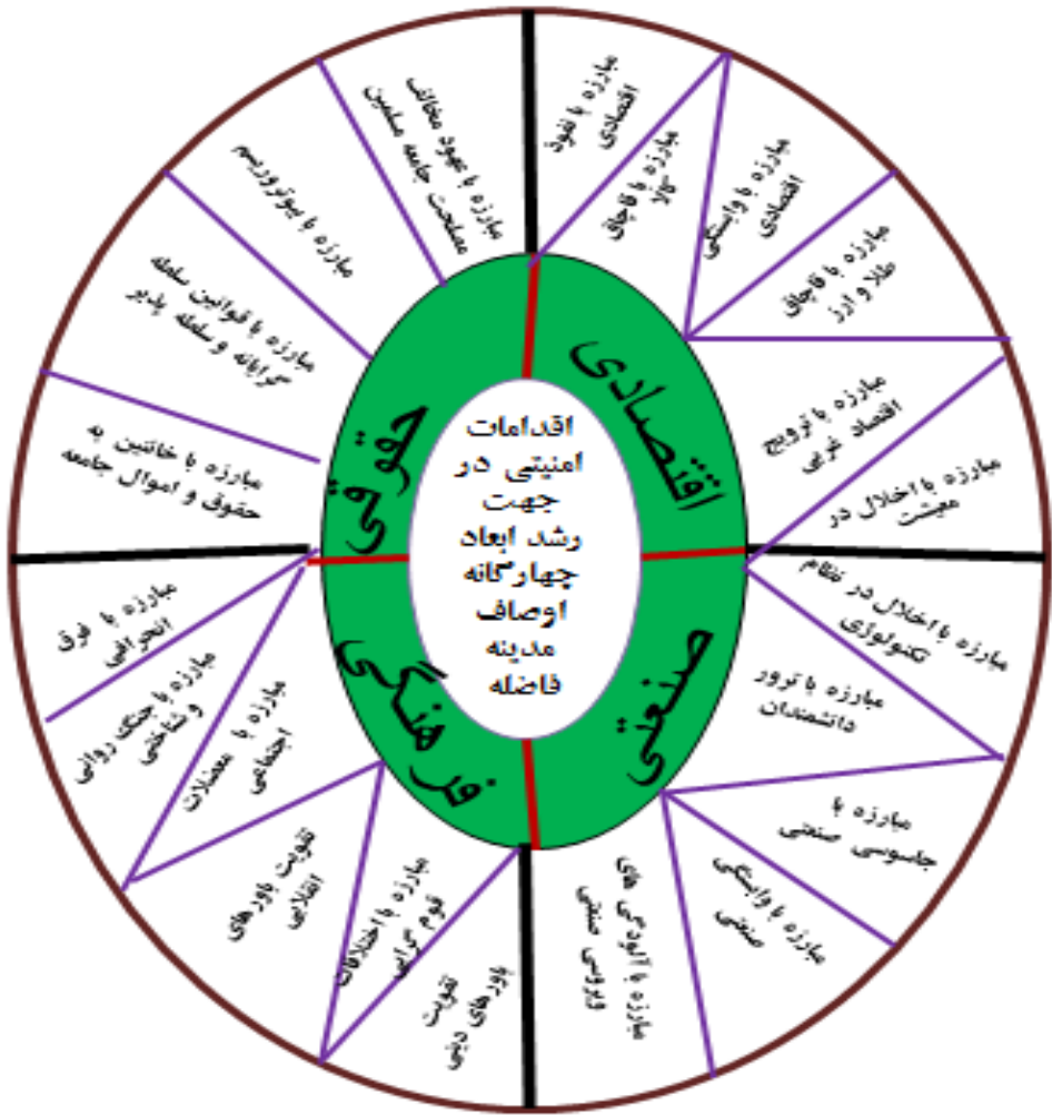
نمودار شماره ۳: اقدامات امنیتی در جهت رشد ابعاد اوصاف چهارگانه مدینه فاضله