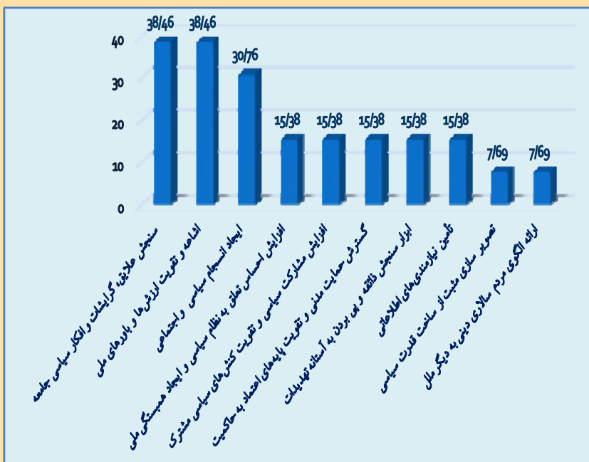
فرست‌ها یا کارکردهای مثبت شبکه‌های اجتماعی مجازی در ابعاد سیاسی و امنیتی

نمودار میله‌ای شماره ۳: فرست‌ها یا کارکردهای مثبت شبکه‌های اجتماعی مجازی در بعد سیاسی و امنیتی در ج.ا.ا.