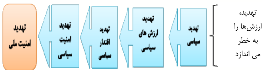
شکل شماره ۱: بررسی اثر تهدیدها

بی‌توجهی به ارزش‌ها، مشروعیت و مقبولیت یک نظام را زیر سؤال می‌برد. این پدیده سبب نوعی ناهماهنگی بین نظام اجتماعی و نظام حاکم می‌شود. از نظر جانسون، ورود ارزش‌های جدید و نامناسب با یک نظام اجتماعی به آن جامعه، سبب ناهماهنگی نظام اجتماعی با نظام حاکم می‌شود و زمینه‌ساز تغییرات بنیادین در آن جامعه خواهد شد. بنابراین ارزش‌ها مبنای دوام و قوام ثبات جامعه هستند. در بررسی تهدید فرهنگ، ارزش‌ها و باورهای ملی جامعه ایران، باید به دو بعد توجه کرد: یکی تهدید ارزش‌ها و باورهای ملی به صورت غیرعامدانه و تنها ناشی از ورود ناخواسته این فناوری‌ها به کشور است. بعد دیگر، تهدید ارزش‌ها و باورهای ملی به صورت یک برنامه از پیش تعیین شده و غیرخوشونت آمیز به منظور تغییر نظام سیاسی کشور است (سلطانی‌نژاد و دیگران، ۱۳۹۲: ۹۵). امروزه ظهور اینترنت و شبکه‌های اجتماعی مجازی شدت و دامنه این گونه فعالیت‌ها را وسیع‌تر ساخته است. این تهدیدها که در قالب جنگ نرم صورت گرفته و با تهدیدهای سابق یعنی نظامی و اقتصادی ماهیت متفاوتی دارد و در راستای دیدگاه ابزارگرایانه دولت‌های غربی به فناوری‌های نوین (دسامبر ۱، ۲۰۰۷) قرار دارد. بیشتر نظریاتی که در مورد جنگ نرم ارائه شده است، بر این نکته تأکید دارند که هدف اصلی و ماهوی عاملان جنگ نرم، ایجاد لغزندگی، شک و تردید در باورهای افراد یک جامعه نسبت به الگوهای ارزشی، فکری و فرهنگی موجود در آن جامعه است تا در مرحله بعد، الگوهای مورد نظر خود را بر این افراد تحمیل کنند.